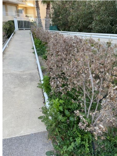
Végétaux desséchés déplantés