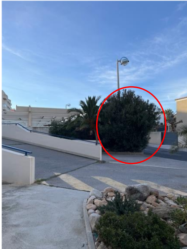
Taille sévère du laurier et mise en valeur du palmOier